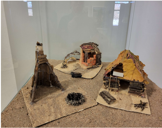
Hütte auf einer einsamen Insel

In der 10. Klasse liegt dann der Schwerpunkt des Kurses auf dem Thema „Architektur“. Es geht um Grundbegriffe der Architektur, um Planung, Zeichnung und Modellbau.