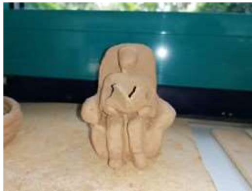
Skulpturen aus Ton