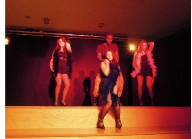
Bilder aus Aufführungen der Q2 ‚Brecht in Echt‘, ‚Der Wahrheit verpflichtet‘ und WPU 10