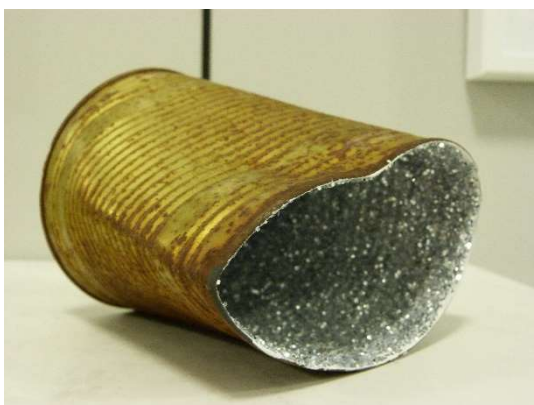
Skulpturen aus Fundstücken